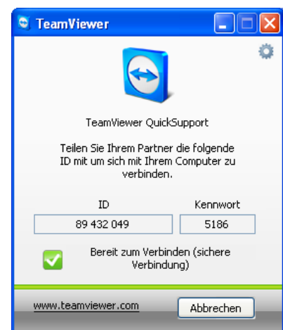
Abbildung 2: TeamViewer wartet auf eine Verbindung von außen

Wenn Ihr Fenster wie in Abbildung 2 aussieht, ist die Installation abgeschlossen. Damit wir uns mit Ihrem Computer verbinden können, benötigen wir die beiden Zahlen, die unter ID und Kennwort angezeigt werden.